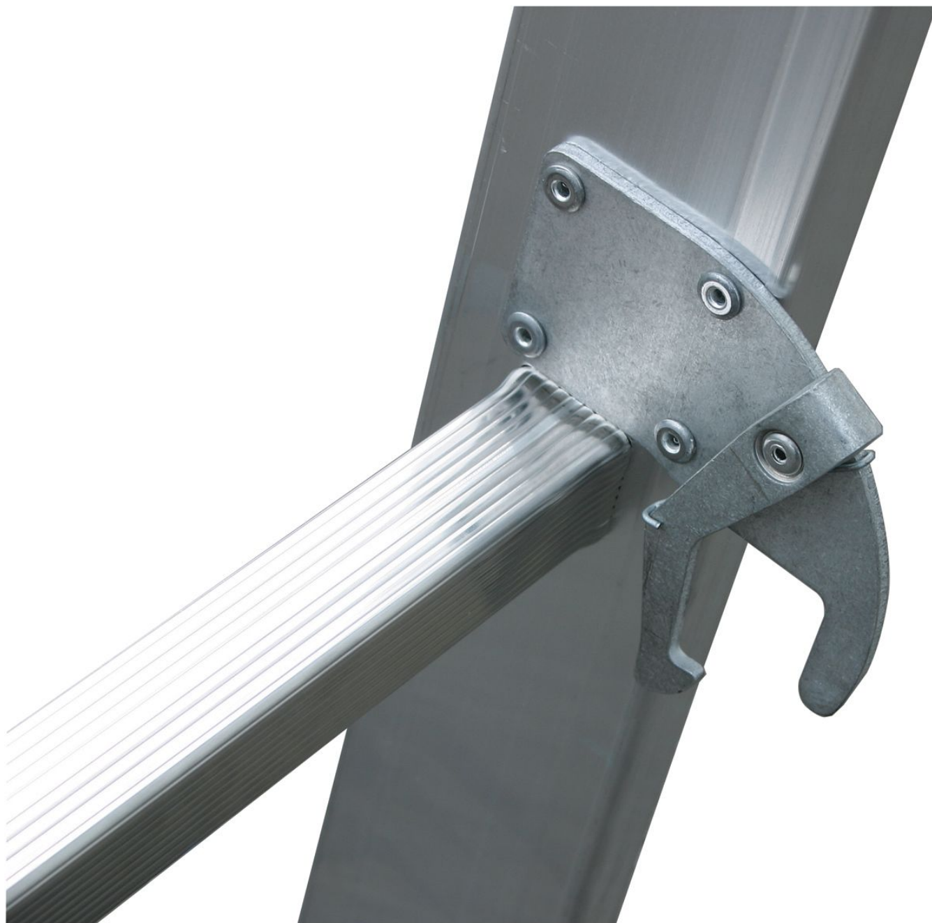
Samozabezpieczające się zaczepy zapobiegają samoczynnemu rozsunięciu/złożeniu się drabiny (system AutoSnap)