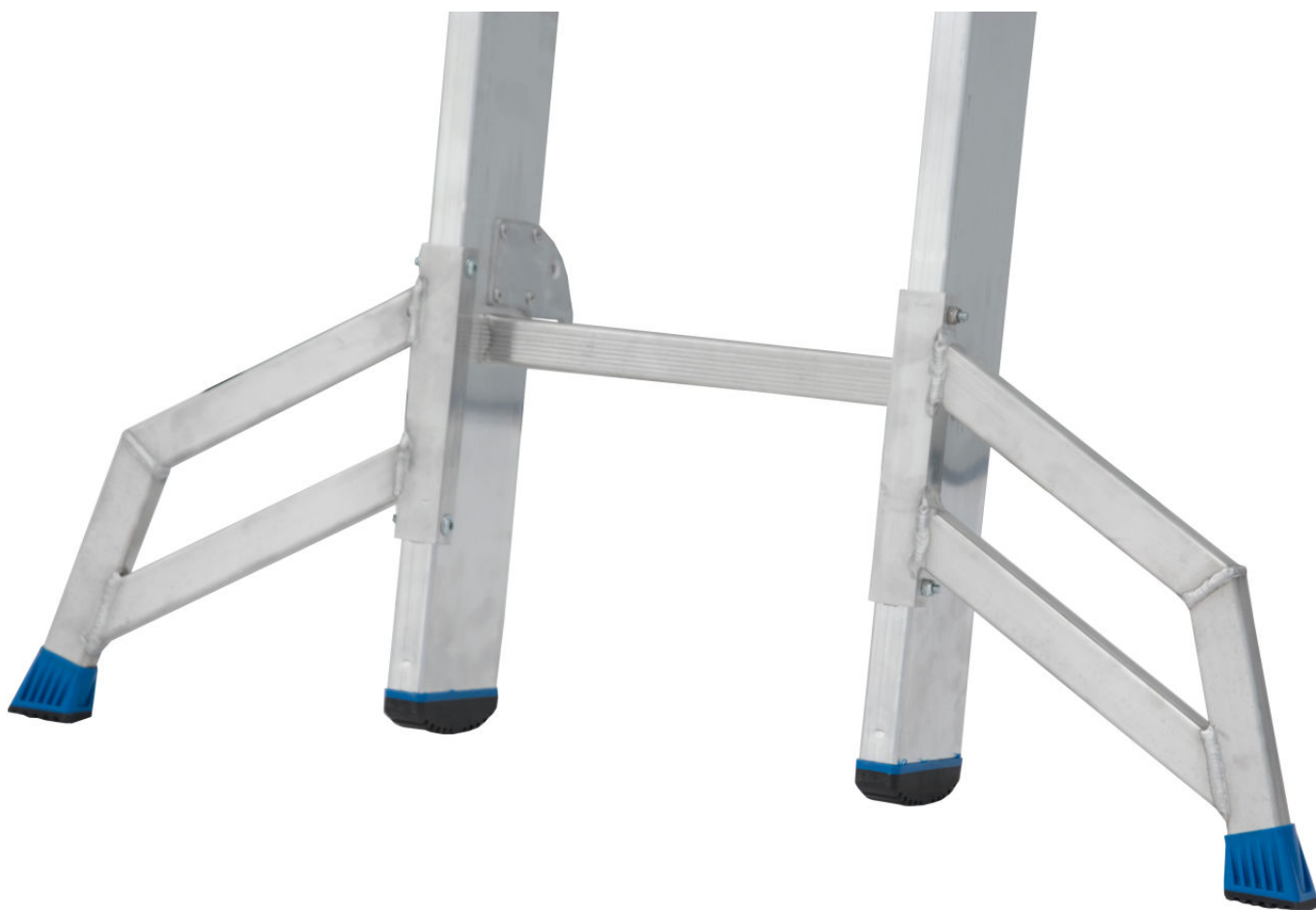
Stabilizator Trigon służy do użytkowania wysuwanego elementu drabiny