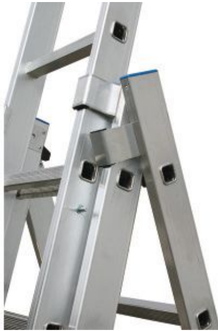
Prowadnice aluminiowe ułatwiają rozsuwanie drabiny