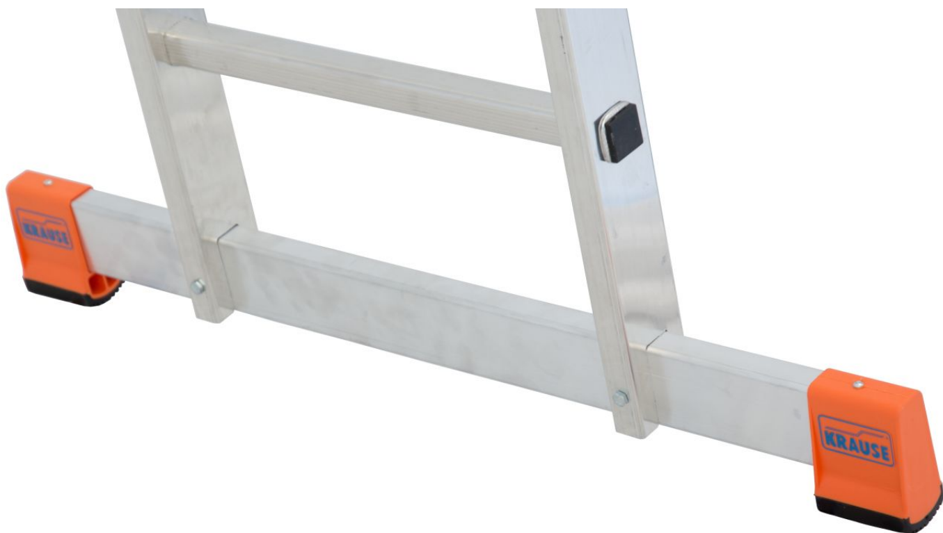
Szeroki stabilizator zapewniający bezpieczeństwo prac.