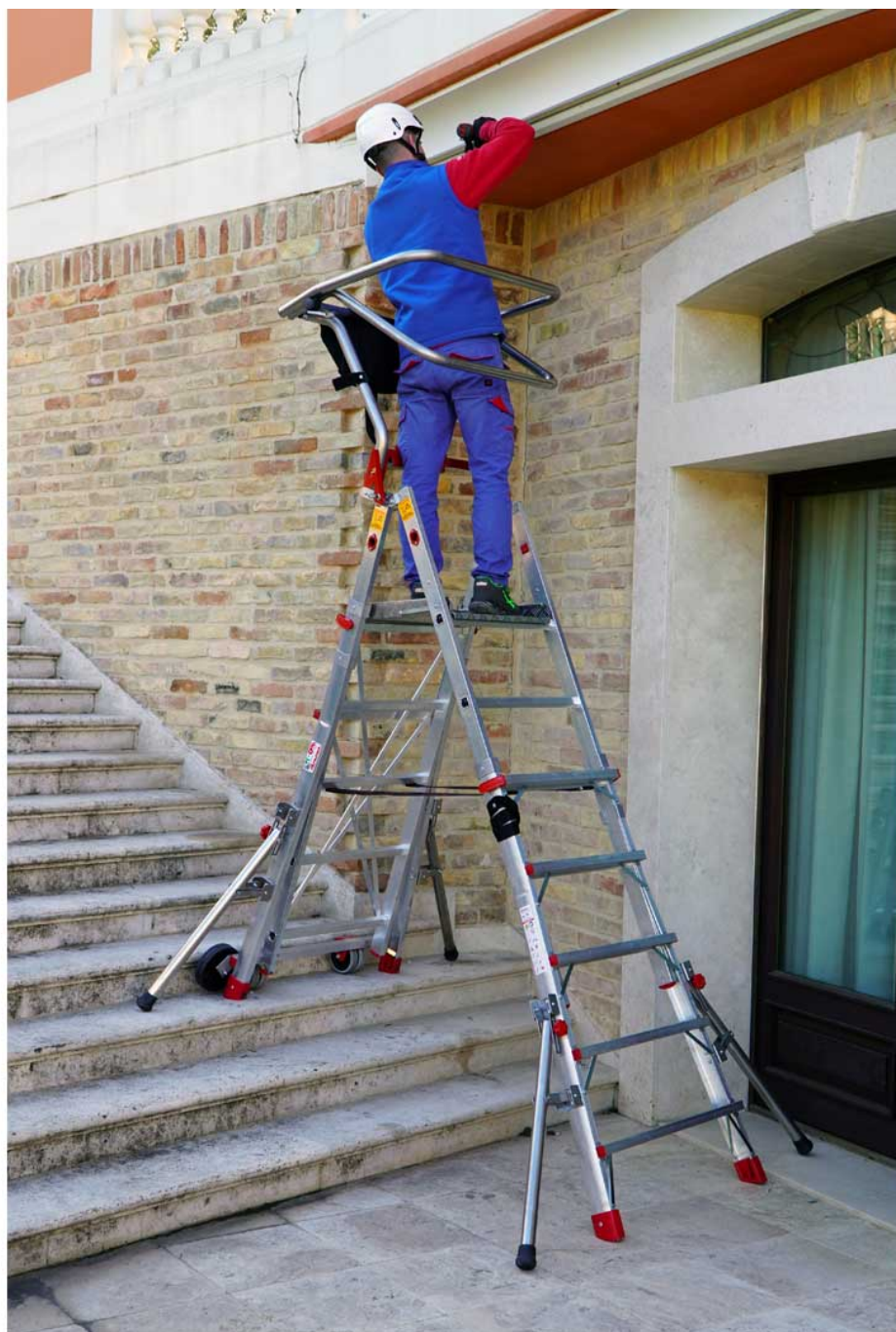
*Rysunek przedstawia model PLS55