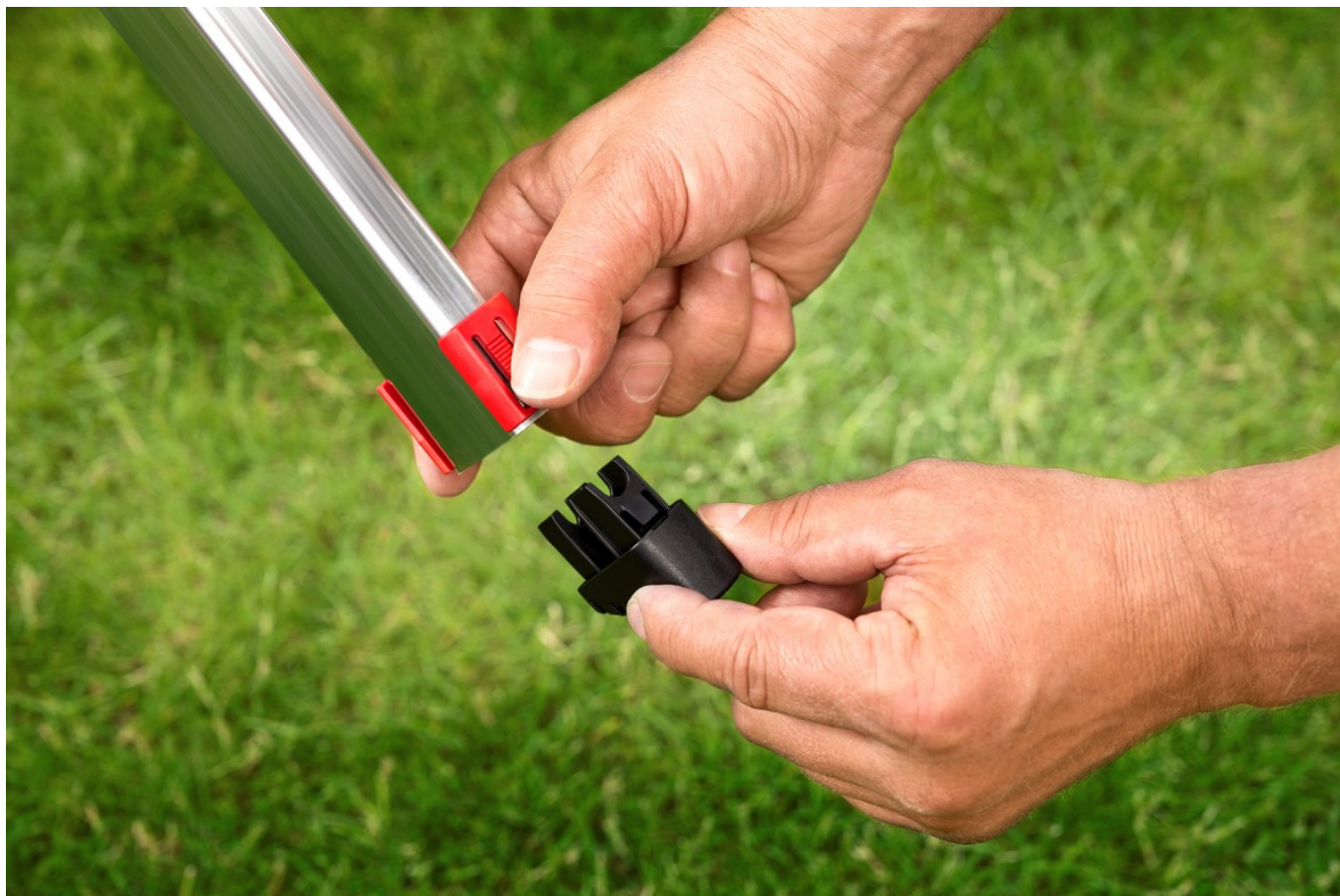
Ekspresowa wymiana, wystarczy ścisnąć klips i usunąć stopkę